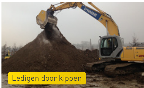
Ledigen door kippen

Elke menger kan aangepast worden aan elk type lader door de koppeling die aan de menger vastgeschroefd is.