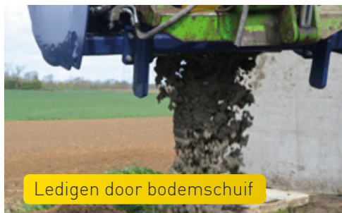
Ledigen door bodemschuif