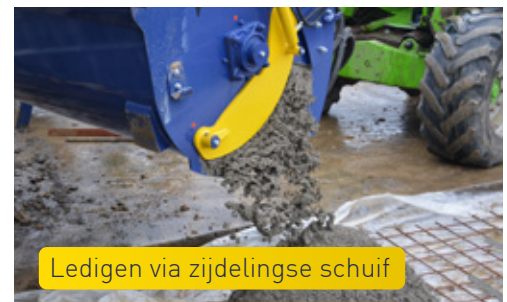
Ledigen via zijdelingse schuif