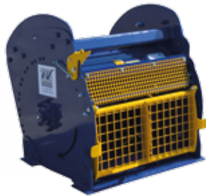
Belgisch ontwerp en constructie